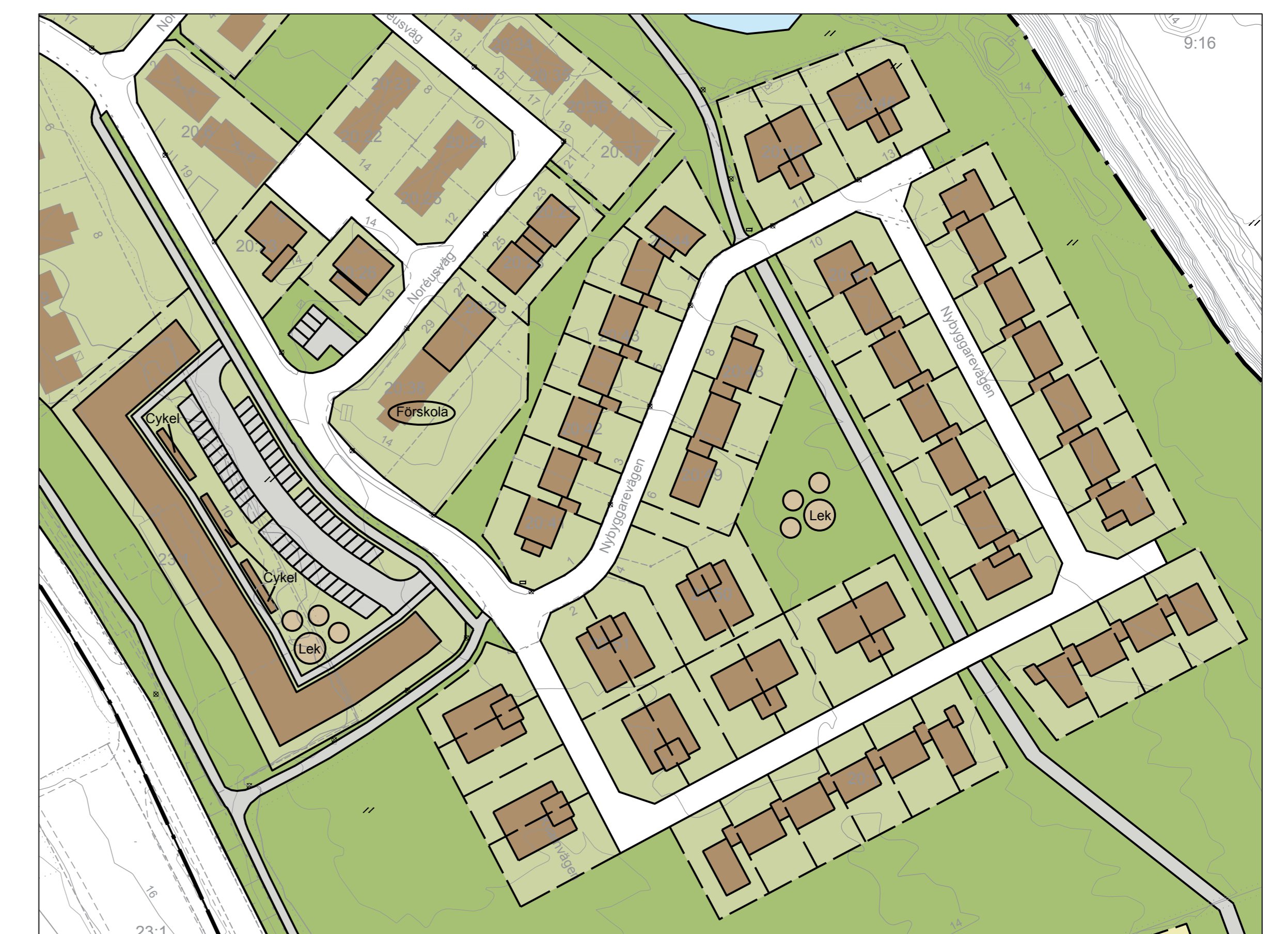
Exempel på alternativ utformning med flerbostadshus, parhus och kedjehus

Skala 1:1000 0 10 20 30 40 50 60 70 80 90 100 meter